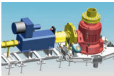
Abb. 2: Schemazeichnung des Leitner-Unterflurantriebes mit einseitigem Eintrieb in das vierstufige Planetengetriebe