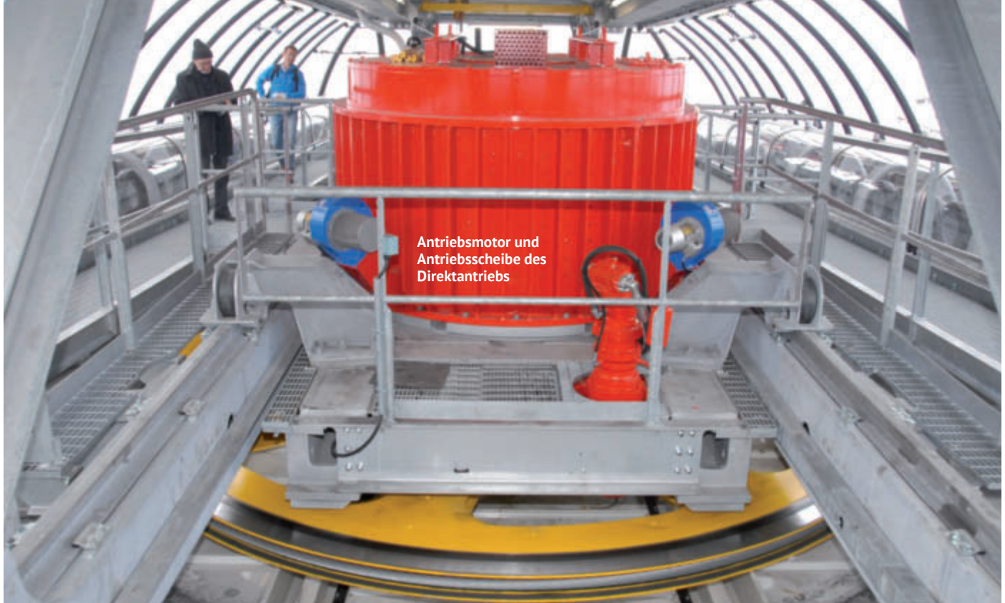
Antriebsmotor und Antriebscheibe des Direktantriebs